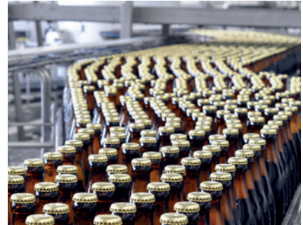
Lecküberwachung von Abfüll- anlagen (Sicherheit)