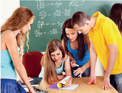
Raumluftqualität (Indoor Air Quality)