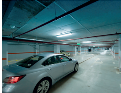
Überwachung von Tiefgaragen (Sicherheit)