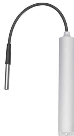
LOG-PT1000-ET030-RC / HL-RC-T030