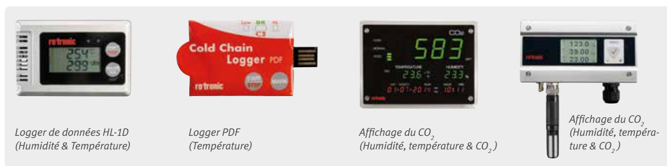
Logger de données HL-1D (Humidité & Température)