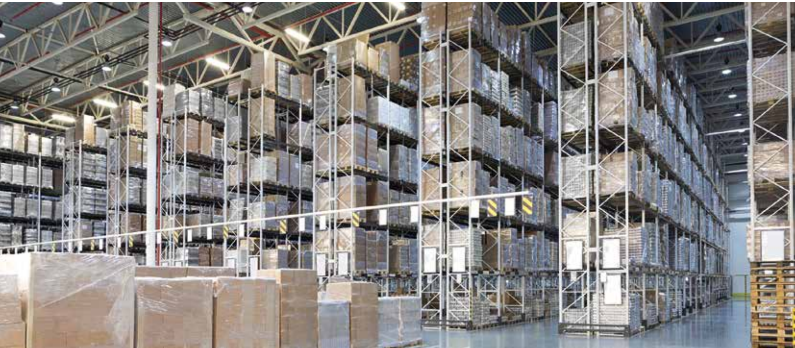
Cartographie de la température et de l'humidité dans des entrepôts...

L'assurance de la qualité des produits pendant le transport ou l'entreposage, par exemple pour les médicaments, est un élément important des directives GxP. La base du respect des prescriptions légales est la qualification de la conformité des dispositifs de transport ou de stockage avec GxP. Rotronic a acquis une réputation de spécialiste de ces prestations et vous offre des solutions efficaces et totalement adaptées à vos besoins.