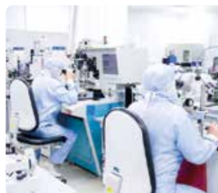
...Unités de production