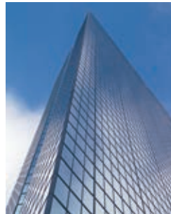
Climatisation/gestion de bâtiment