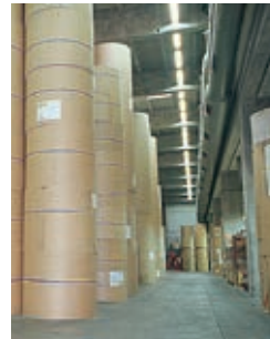
Industrie du papier