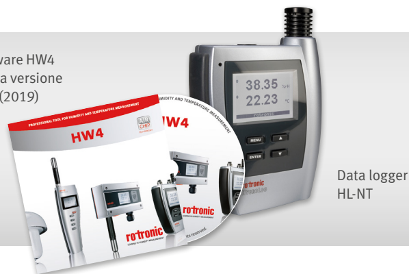
Data logger HL-NT

Software HW4 Ultima versione V3.9 (2019)