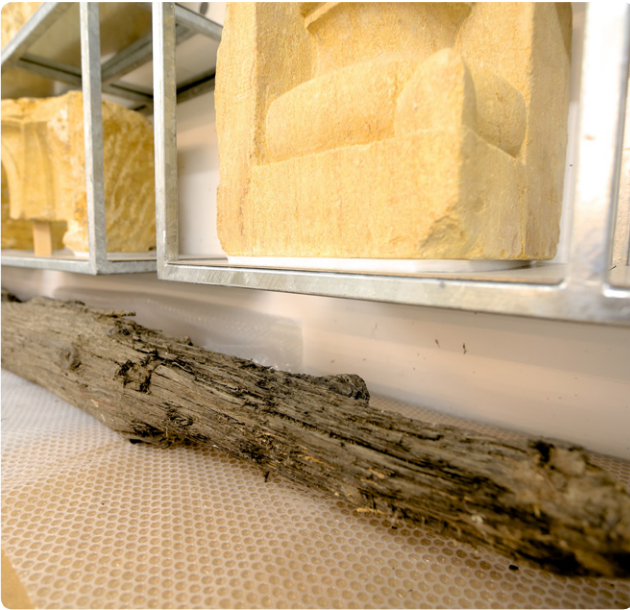
Das Labor für die Datierung von Holzobjekten (Dendrochronologie) ermöglicht eine exakte Datierung.