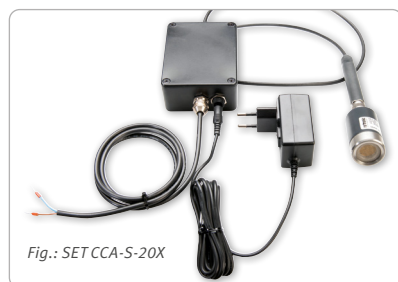
Fig.: SET CCA-S-20X